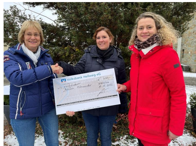
Stiftung Maria Hilf Warstein unterstützte mit einer Spende das Netzwerk Miteinander. Es setzt sich für eine flächendeckende pflegerische und betreuende Versorgung im Raum Warstein und Rütten ein.