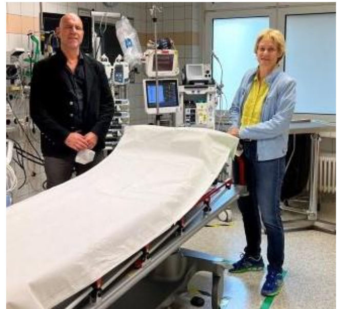
Die Stiftung Maria Hilf unterstützte das MVZ Warstein mit der Anschaffung einer Patienten-Transportliege.