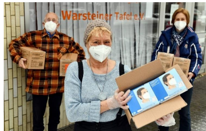
Der Warsteiner Tafel wurden 700 FFP-2-Masken für Mitbürgerinnen und Mitbürger, die auf eine Unterstützung angewiesen sind, gespendet.