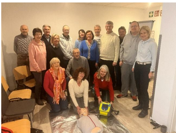
Kegelfreibunde „Pfiffige Kobolde“ und weitere Teilnehmer ließen sich Ende November 2025 zu Corhelfern ausbilden.

Bei einem plötzlichen Herz-Kreislauf-Stillstand kommt es auf jede Sekunde an, um lebenswichtige Organe weiterhin mit ausreichend Sauerstoff zu versorgen und irreparable Hirnschäden zu vermeiden.