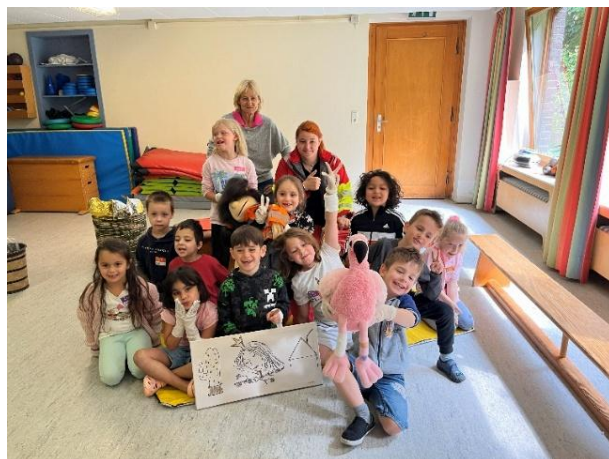
Die Kinder der KitTa Kunterbunt lernten im Sommer 2025 mit den Puppen Ingo und Hedi spielerisch Erste Hilfe.

In dem 3stündigen Schnupperkurs „Kleine Helferbande“ lernen schon die Kleinsten spielerisch die Grundlagen der Ersten Hilfe. Dazu gehört das Absetzen eines Notrufs, das Anlegen von Verbänden, die stabile Seitenlage sowie das Verhalten in Notfällen.